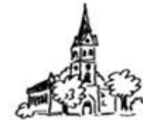
Christuskirche in Isenstedt