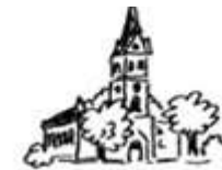
Christuskirche in Isenstedt